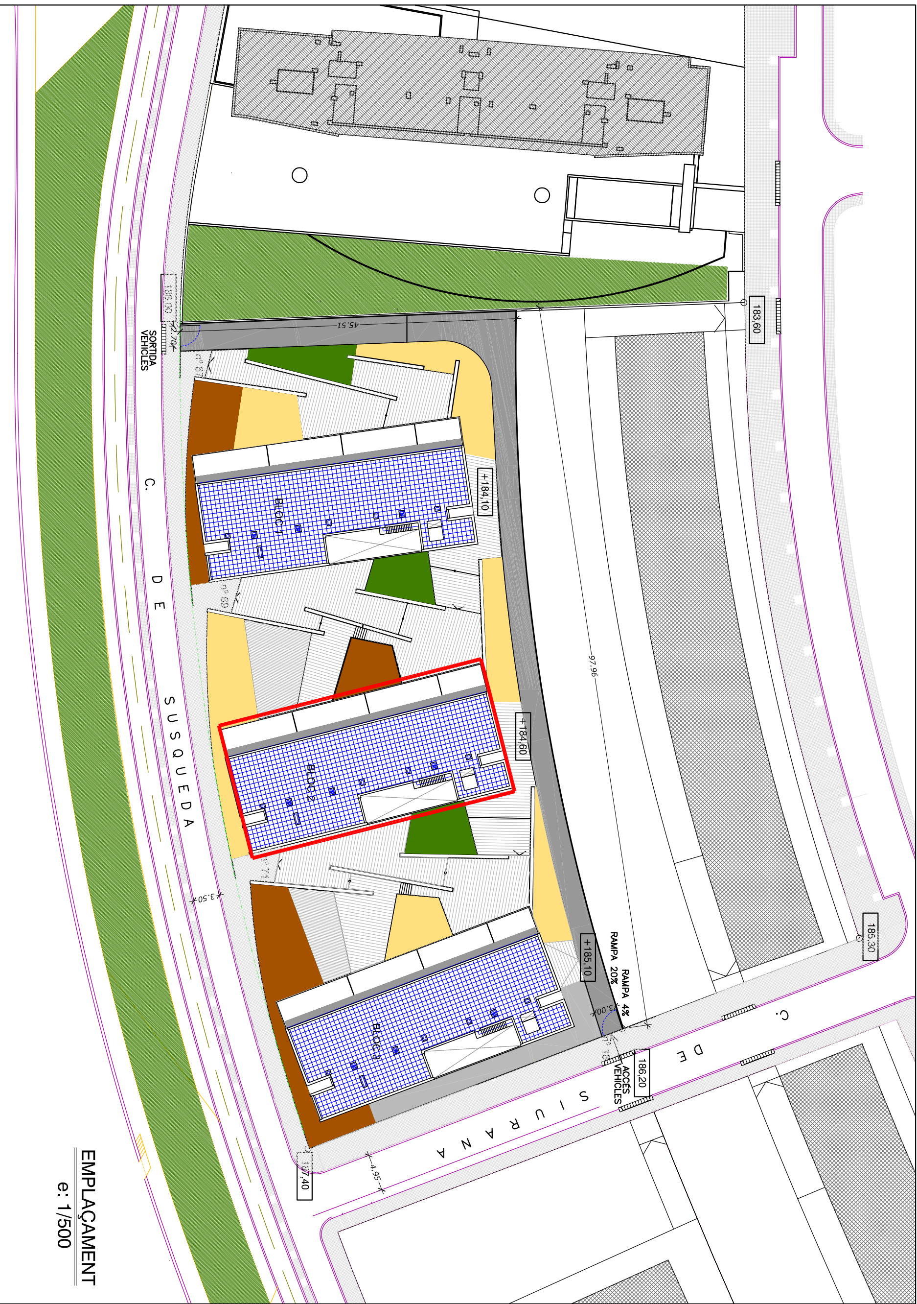
EMPLAÇAMENT e: 1/500